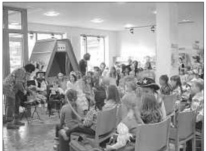
Zahlreiche Kinder folgten der Einladung zur maskierten Vorlesestunde in die Marktbücherei

Abschließend verteilte der Clown noch lustige Hüte aus Zeitungspapier, bevor sich die Kinder, die vom Büchereiteam eine kleine Wegzehrung erhielten, mit ihren Eltern auf den Heimweg machten.